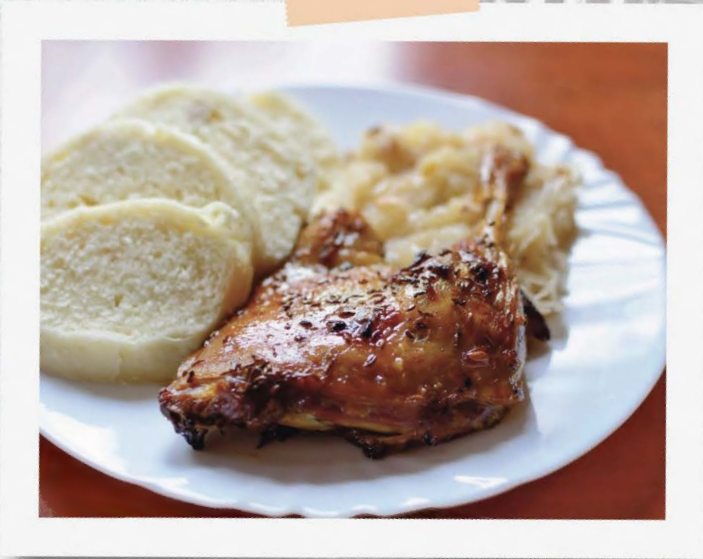
Ilustrační obrázky / Illustration image / Illustrationsbild