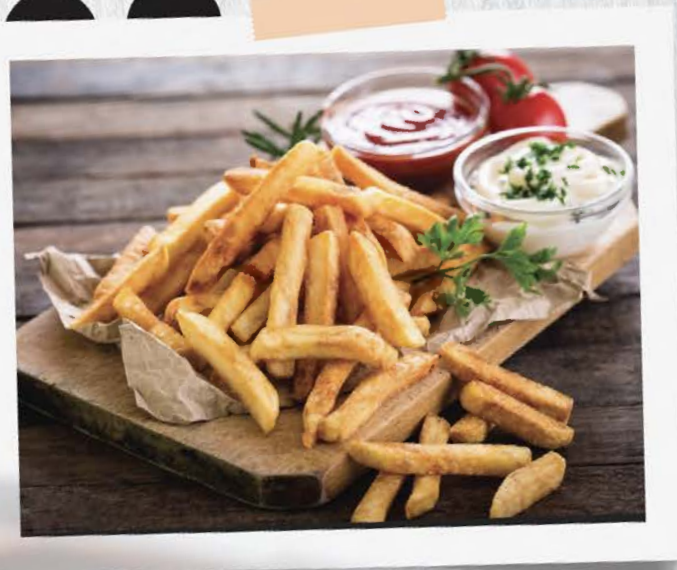
Ilustrační obrázky / Illustration image / Illustrationsbild